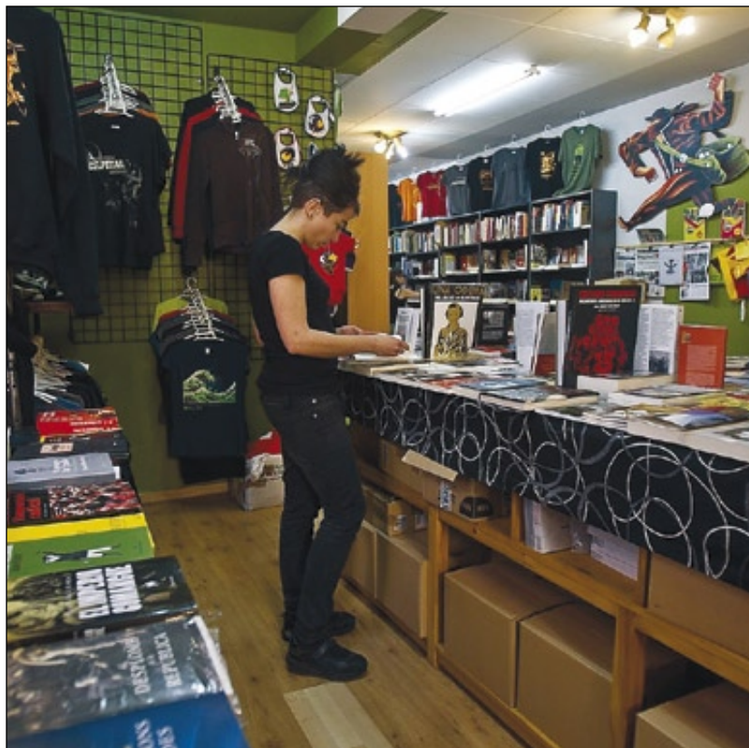
Comerç al barri de Sants.

–assenyala Bover– és sempre aconseguir que el client funcioni bé com a organització, que optimitzi els seus processos i la seva estructura empresarial. Seguidament, ja es pot començar a planificar, per exemple, com s'optimitzen els consums energètics, com es gestionen els residus o com s'augmenta la conscienciació ambiental dels treballadors.