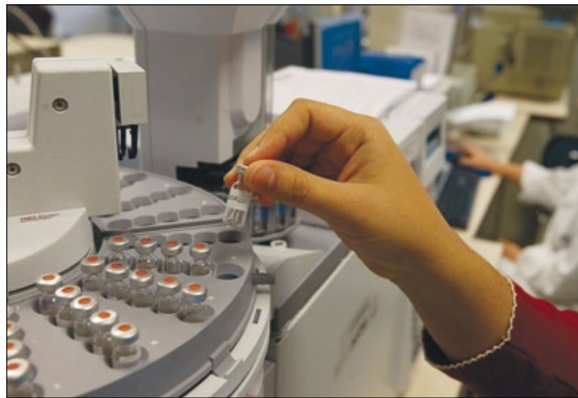
Anàlisi d'una mostra en un laboratori de Barcelona.

En aquest sentit, dels 22 centres que opten al distintiu d'excel·lència Severo Ochoa –que identifica els millors del món en la seva especialitat–, 12 són catalans. Es tracta del Supercomputing Center-Centre Nacional de Supercomputació; l'Institut de Ciències Fotòniques; l'Institut Ca-