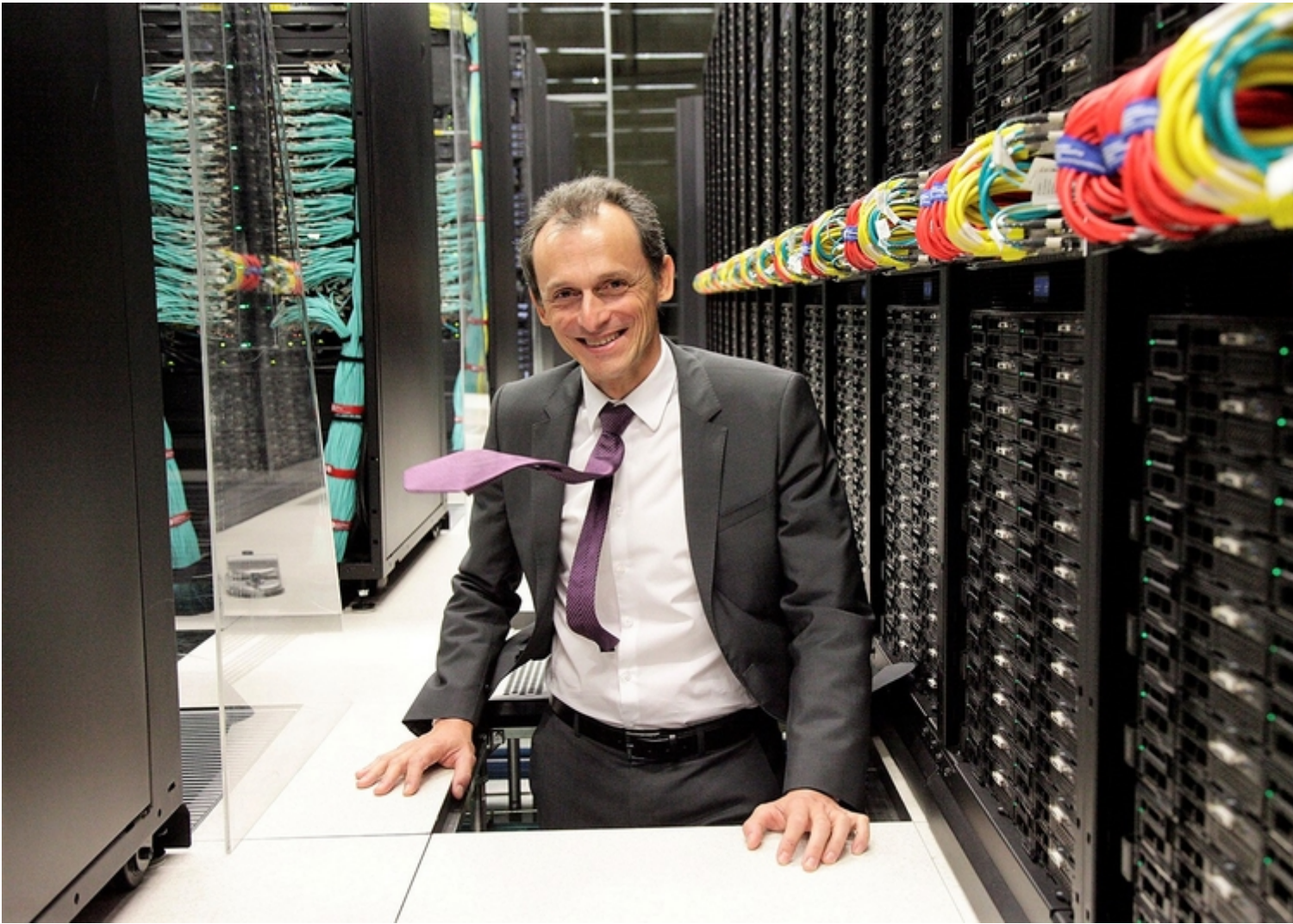
Barcelona Supercomputing Center - Centro Nacional de Supercomputación

Source URL (retrieved on 13 Ago 2024 - 00:52): https://www.bsc.es/es/noticias/noticias-del-bsc/el-ministro-de-ciencia-pedro-duque-visita-el-bsc